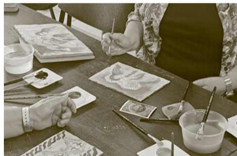
Maľovanie gotických výjavov a ornamentov na drevenú kazetu do vlhkej omietky.

Pre najmenších bol počas prázdnin zorganizovaný letný tábor, ktorý bol celý venovaný gotike. Konal sa pod názvom VI. letný múzejný tábor pre deti v partnerstve s OZ Gotická cesta - Gotika s Banickým múzeom v dvoch turnusoch. Prvý turnus sa konal v dňoch 17. - 21. a druhý turnus 24. - 28. júla 2023 pre vekovú kategóriu od 6 do 10 rokov s pestrým programom. Účastníci