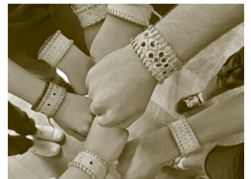
Vyrobené kožené náramky.

dajú do kontaktu veľmi zriedkavo. Účastníci tvorivých dielni pracovali s potešením a záujmom, čoho dôkazom boli ich kreatívne výrobky.