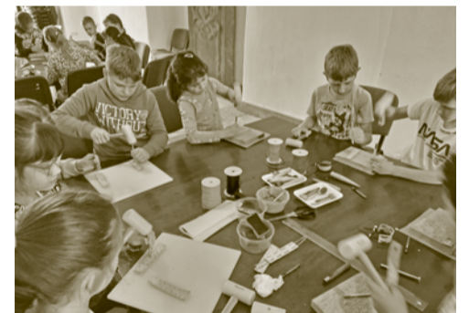
Na tvorivej dielni - práca s kožou.

Výstava aj múzejno-pedagogický program bol pre malých aj dospelých návštevníkov mimoriadne zaujímavý, keďže s týmto prírodným materiálom a remeslom už prichá-