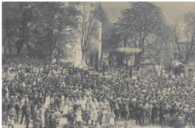
Verejné zhromaždenie na námestí v Rožňave (okolo roku 1920).

Károlyiho vlády a francúzskym veliteľom na Balkáne generálom Franchetom d'Esperayom. Podľa 17. článku dohody mala administratíva a vojenská správa na území celého Uhorska zostať v rukách maďarskej vlády, a to až do rozhodnutia mierovej konferencie.