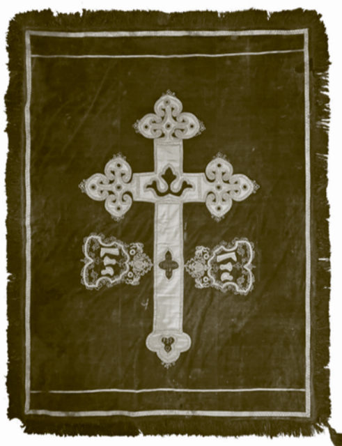
Pohrebná prikrývka čižmárskeho cechu po reštaurovaní.

Odborné ošetrovanie reštaurátorom na textil zabezpečí zachovanie umeleckej a kultúrnej hodnoty predmetu, ktorý bude možné následne sprístupniť verejnosti na výstavách