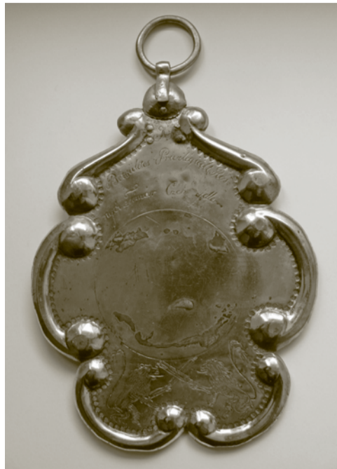
Zvolávacia tabuľka rožňavského cechu garbiarov, 1836.

dvoch oproti sebe stojacich levov, držiacich dva prekrížené pracovné nástroje – garbiarske nože. Na zadnej strane tabuľky je schránka na uloženie správy zdobená rytým motívom listov a kvetinovým motívom, s „rozsypaným“ vročením 1836.