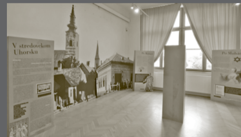
Pohľad na bannery výstavy.

Hlavnou myšlienkou výstavy sa tak stalo priblíženie dejín židovského obyvateľstva na východnom Slovensku, a to predovšetkým študentom základných a stredných škôl, resp. gymnázií, ale rovnako aj širokej verejnosti, pričom osobitná pozornosť bola venovaná dejinám židovskej komunity v Rožňave, ako aj celospoločenským zmenám, ktoré priniesol rok 1938, keď sa postavenie židov