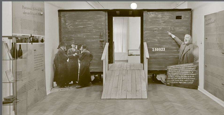
Kópia vagóna určeného na prevoz židovského obyvateľstva do koncentračných a vyhladzovacích táborov.

Návštevníci Galérie Banického múzea si mohli výstavu pozrieť v období od 17. februára do 15. mája 2023. V rámci sprievodných podujatí k uvedenej výstave bola 20. apríla 2023 zrealizovaná aj prednáška určená širokej verejnosti, na ktorej sa mohli všetci záujemcovia dozvedieť bližšie informácie o dejinách židovského obyvateľstva na východnom Slovensku do roku 1918. ■