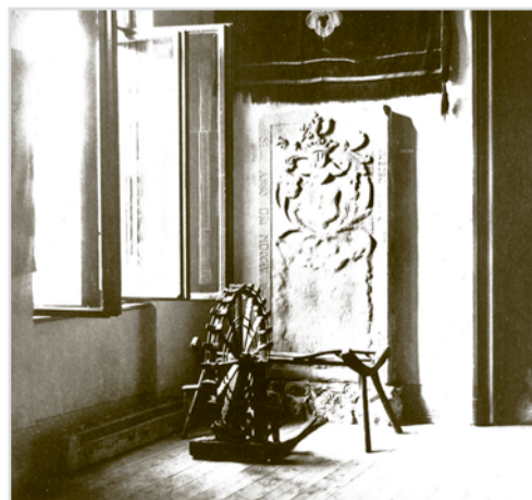
Jeden z epitafov - epitaf neznámej osoby v expozícii zjednoteného múzea otvorenej v roku 1943.

Hlboká myšlienka v maďarskom jazyku v podobe textu vysekaného na celej prednej ploche epitafu vznešenej panny Barbary Fucher, narodené v júli 1799 a zosnulej v novembri 1811 v preklade znie: Nemilosrdná smrť, čo som urobila zle, že som žila na jar a nemohla som žiť v lete, stratila som svojich drahých rodičov, z ktorých som sa stala nocou. Sladkú nádej pochoval hrob. Nie je sa ako utešovať, môj otec smúti, matka plače, niet lieku na útechy nad hrobom! Tento kameň môže stlačiť moje padlé skutky, červy a chrobáky môžu hrýzť všetky moje časti. Som pokojná, ale strácam city. Moje srdce stále krváca, ľutujem svojich bratov. Pútnik, nauč sa, že všetko je pominuteľné. Mladí aj starí sú rovnako smrteľní. Za rakovou je večnosť, tam je šťastný život, tam je to, čo je nekonečné, večné. ■