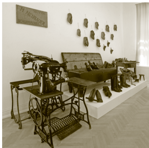
Výstava Koža a kožušina - od úžitku k luxusu.

Projekt z verejných zdrojov podporil Fond na podporu umenia sumou 8 000 eur, pričom spolufinancovanie predstavovalo 970 eur. Vďaka dotácii z Košického samosprávneho kraja bol k výstave vydaný aj katalóg v slovenskom a maďarskom jazyku. ■