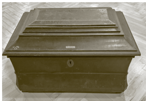
Truhlica rožňavského cechu garbiarov, 18. stor.

V súčasnosti sa o živote garbiarov dozvedáme aj prostredníctvom zbierok, vďaka ktorým spoznáваме ich súkromný, verejný, predovšetkým však cechový život, a ktoré sú významným prameňom informácií o remeselníckej minulosti nášho mesta.